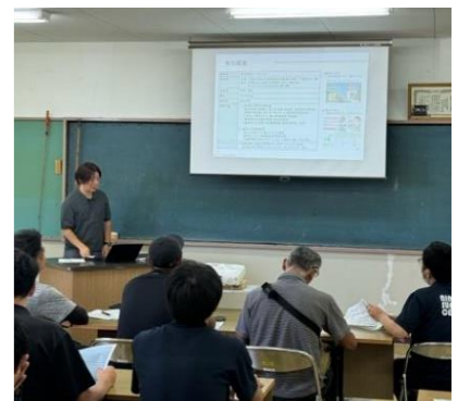
(文責：研修会運営担当 佐藤)

壱岐農業法人会は、島内で人材を確保することや雇用した人材の定着が課題となっていたため、「基本的な雇用管理」や「人材育成」をテーマとして研修会を実施しました。後半は3班に分かれてワークショップ形式にて、課題の抽出を行いました。研修会終了後の参加者アンケートから、満足度は「大変満足」、「満足」の回答が多く「労働条件や従業員の募集をするのに取り組みたい」というお声をいただきました。